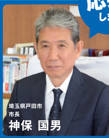
埼玉県戸田市 市長