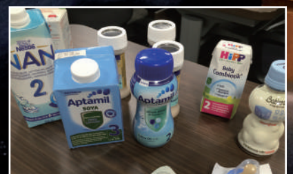
海外で流通している「液体ミルク」